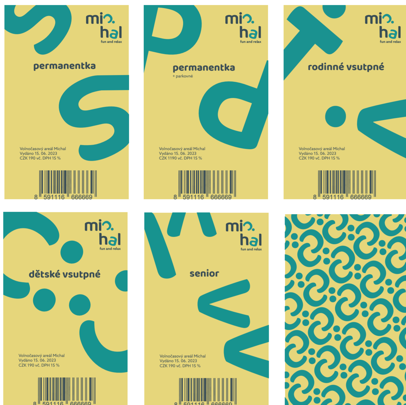
• ukázka vstupenek