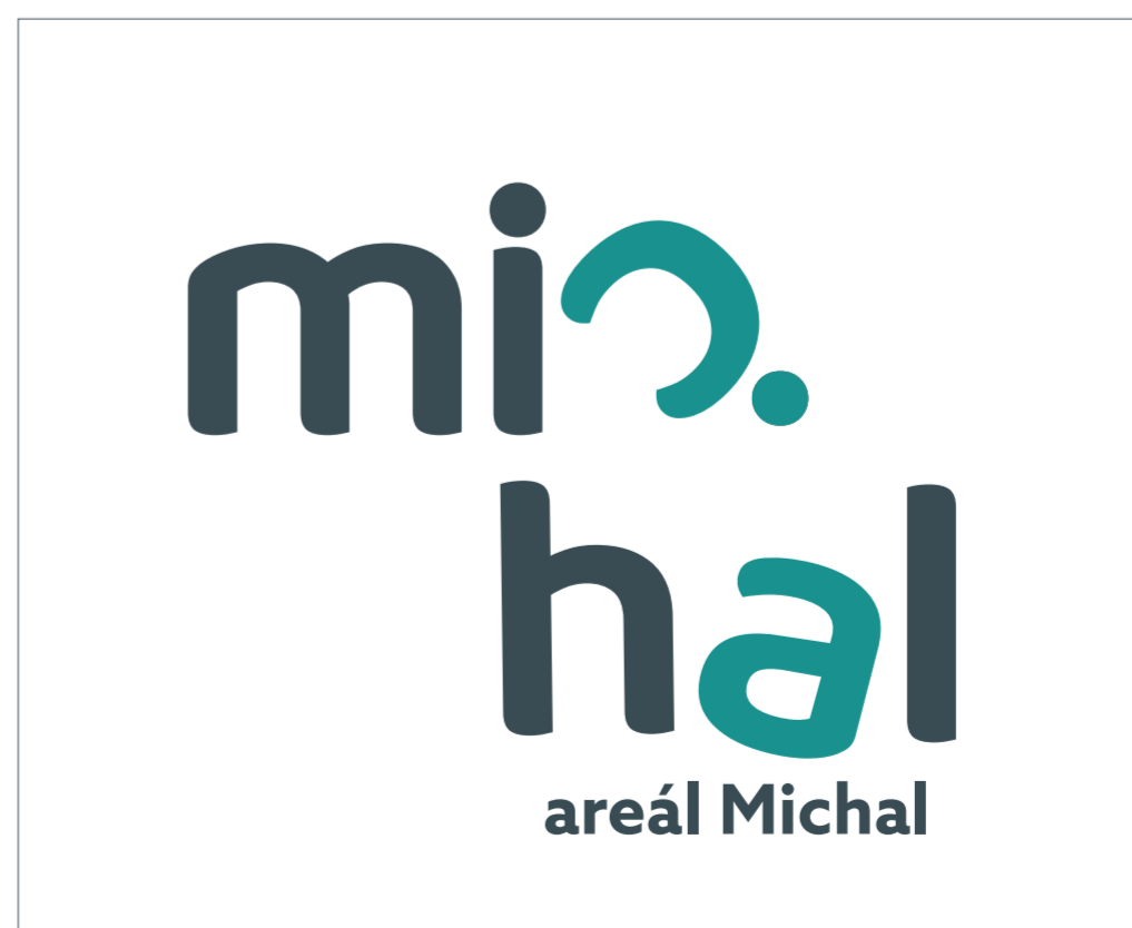
• druhá varianta loga