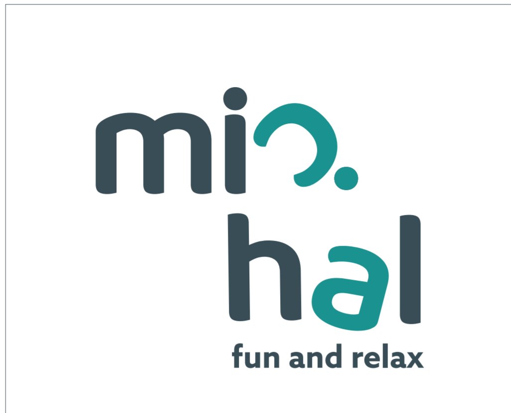
• základní logo (se sloganem)