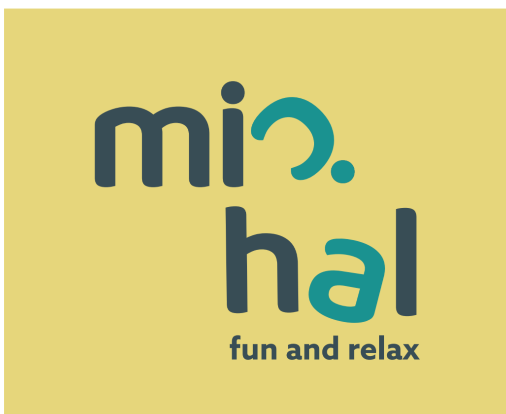
• barevný podklad