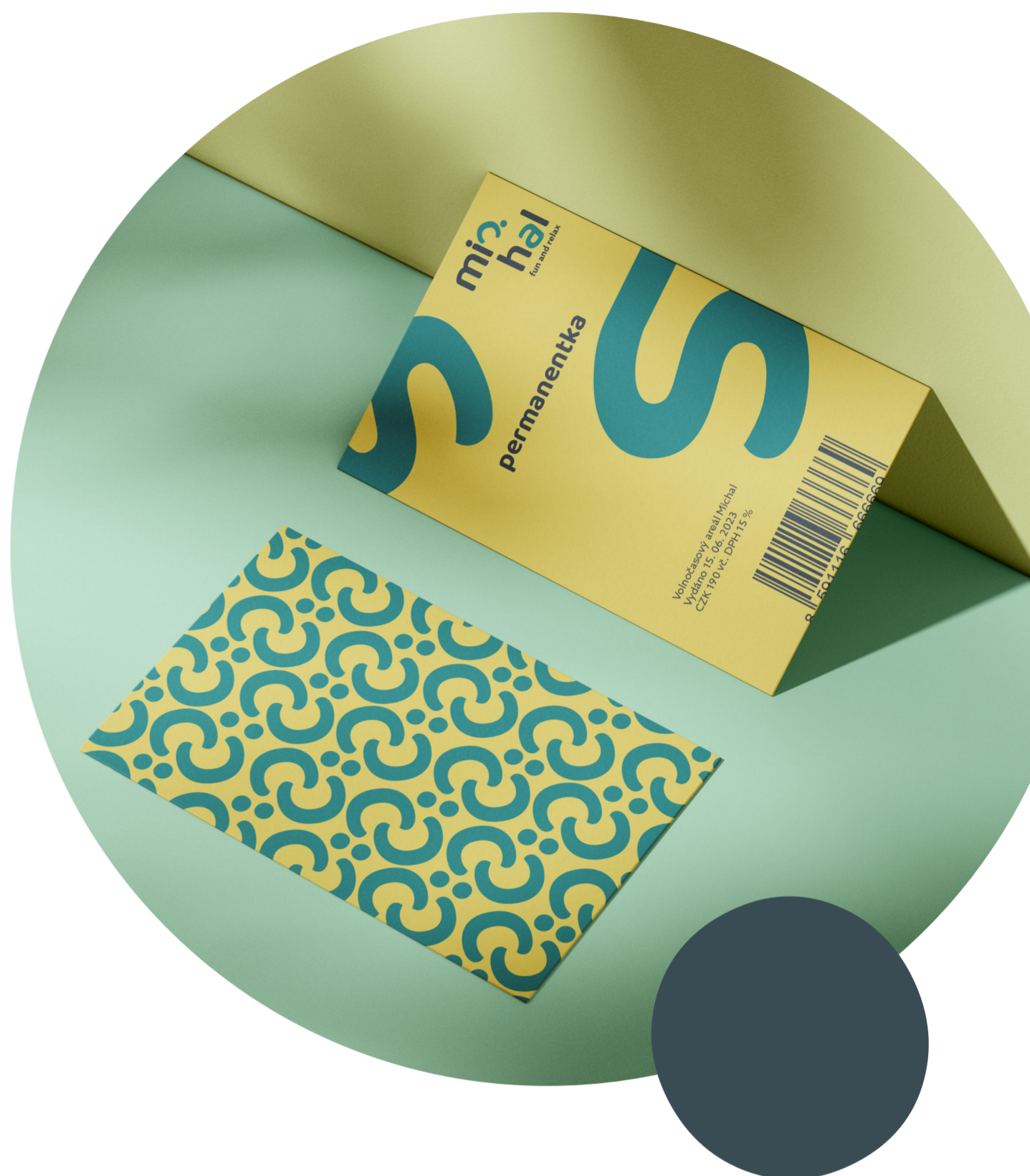
• zadní strana